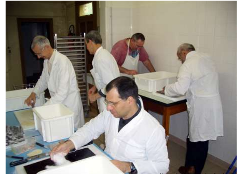
Atelier de pâtes de fruits